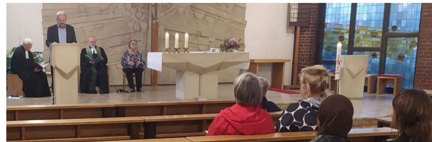
Ökumenischer Gottesdienst zu den Interkulturellen Tagen in Marzahn-Hellersdorf am 17. September 2024

Die nächste ACK-Sitzung ist für November 2024 geplant.