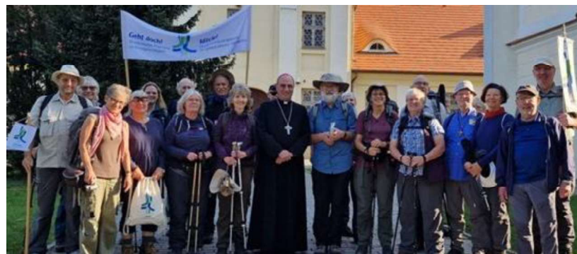
Gruppenfoto mit dem Primas von Polen Wojciech Polak nach dem Eröffnungsgottesdienst in Gniezno am 21. September 2024

zur Gnadenkirche und bereiten Sie den Klimapilgerinnen und Klimapilgern bei uns in Biesdorf einen herzlichen Empfang.