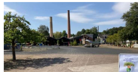
Der Familiengarten in Eberswalde